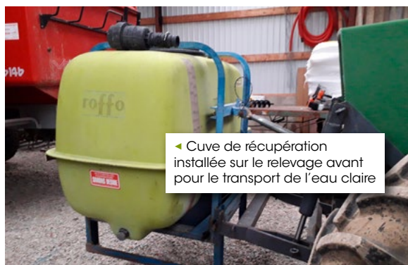
◀ Cuve de récupération installée sur le relevage avant pour le transport de l'eau claire

Il est également possible d'ajouter un circuit d'eau claire lorsque celui-ci n'est pas présent. Il achemine l'eau depuis la cuve de rinçage jusqu'à la cuve principale, éventuellement via les buses de rinçage . Celles-ci permettent de nettoyer efficacement les parois internes de la cuve avec un moindre volume d'eau.