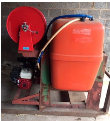
▲ Nettoyeur à moteur thermique avec un enrouleur et une cuve d'eau claire à placer sur le relevage avant du tracteur

Il est aussi possible de s'équiper avec du matériel de nettoyage autonome , par exemple un nettoyeur haute pression thermique équipé d'une pompe auto-amorçante.