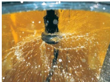
▲ Les gyrolaveurs ont l'avantage de permettre un nettoyage approfondi