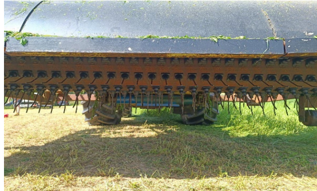
Exemple de prototype avec rotor à dent